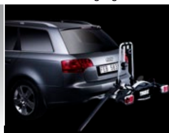
Optionale Laderampe erleichtert die Beladung