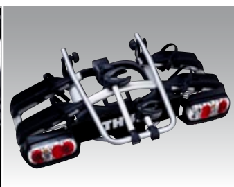
Einfach zusammenklappbar für problemlose Aufbewahrung