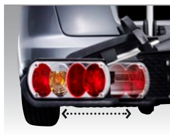
Ausziehbare Felgenhalter und Rücklichter für maximale Flexibilität